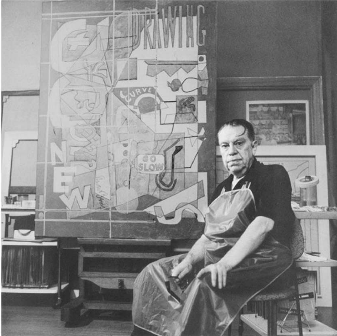
استوارت دیویس . Stuart Davis